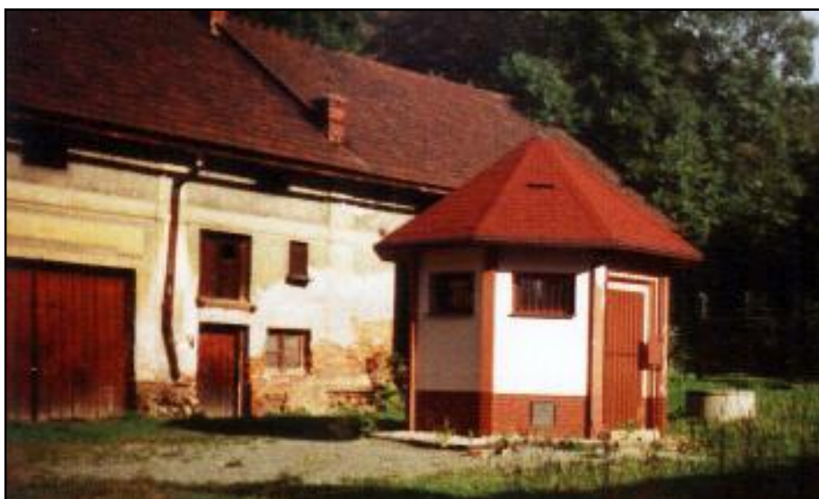
Nová stavba prameníku na dvoře Jiráskova statku.

Na dvoře statku byly podle předpokladů nalezeny minerálky přibližně stejného složení jako Ida. Jeden pramen obsahoval více kyslíčnatého uhlíčitého, hodícího se spíše pro koupele. Proto byly obě minerálky smíchávány. V roce 1995 pak byla nová stáčírna stávajícím vedením přepojena na prameny ze statku. Na jeho dvoře byla vybudována malá nová budova prameníku.