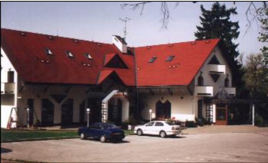
Snímek Hotelu „Bonato“ je z roku 1995. Později byla vpravo k budově přistavěna zimní zahrada. Z levé strany pak ještě venkovní posezení.

Se souvisejícím záměrem modernizace lázní soukromý majitel pan Balcar poněkud níže v prostoru bývalého Hejzlarova statku čp.2 postavil a dal do provozu v roce 1995 nový hotel „Bonato“ pro ubytování návštěv lázeňských hostů a rozšíření turistické atraktivity v oblasti.