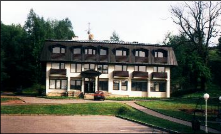
Nad bývalým statkem čp.2 ve stráni byla postavena nová budova „Lesanka“.

Se souvisejícím záměrem modernizace lázní soukromý majitel pan Balcar poněkud níže v prostoru bývalého Hejzlarova statku čp.2 postavil a dal do provozu v roce 1995 nový hotel „Bonato“ pro ubytování návštěv lázeňských hostů a rozšíření turistické atraktivity v oblasti.