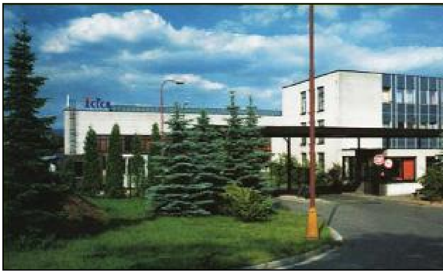
Nová stáčírna Idy na Kladské ulici v provozu od roku 1980.