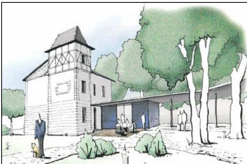
Názorná podoba projektu nových Malých lázní dle článku z Náchodského deníku v roce 2016.

Zatím se v Malých lázních rýsují teprve základy repliky původní vily.